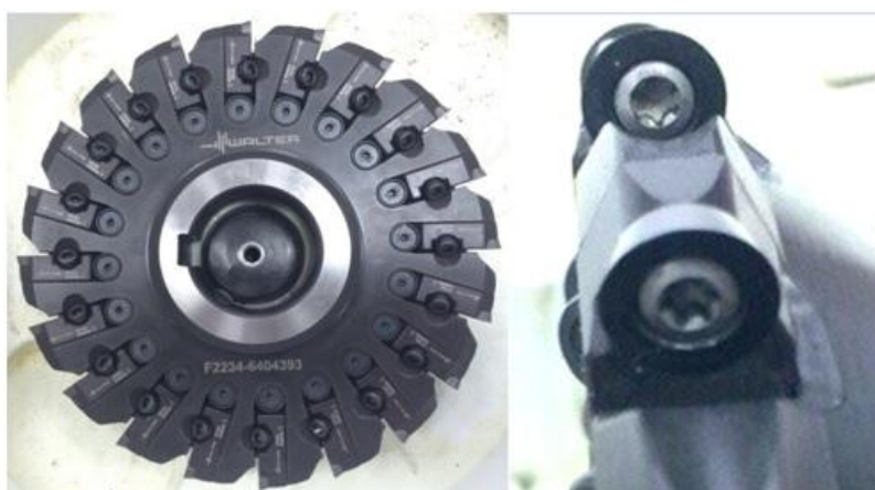
Рисунок 1 - Фреза фирмы Walter

На базе Технополиса Тюменского индустриального университета, при изготовлении технически сложной детали «Ротор винтового забойного двигателя» используют сборную дисковую фрезу фирмы Walter (рис.1), с круглыми неперетачиваемыми пластинами. При производстве этой детали продуктивность механической обработки ограничена недостаточной прочностью и стойкостью сменных режущих пластин[1].